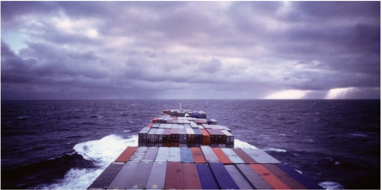
Slika 3. Allan Sekula i Noël Burch, Zaboravljeni prostor